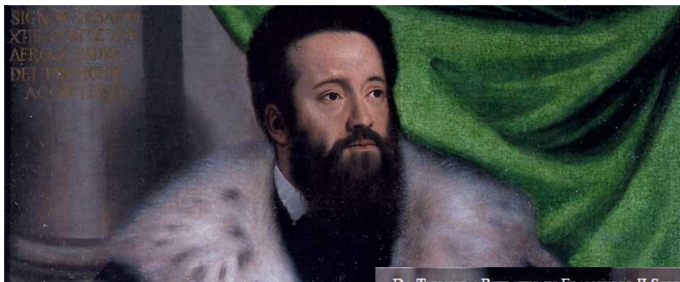
DA TIZIANO - RITRATTO DI FRANCESCO II SFORZA