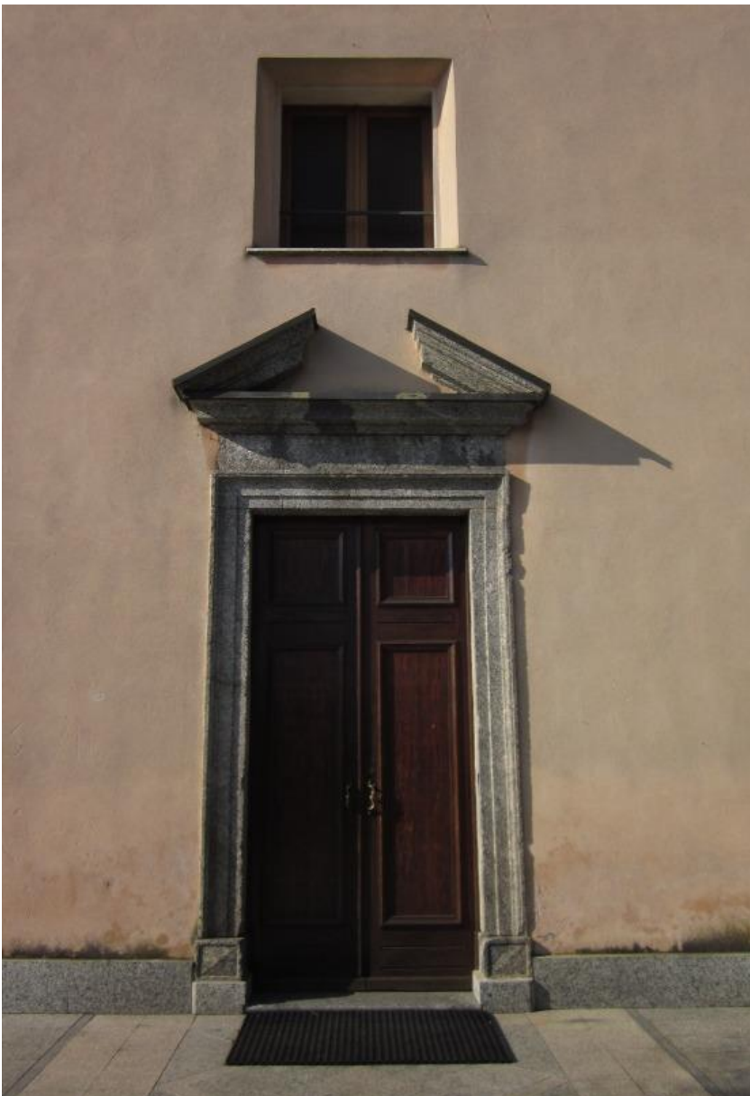
Portale d'entrata della Chiesa di Oriano