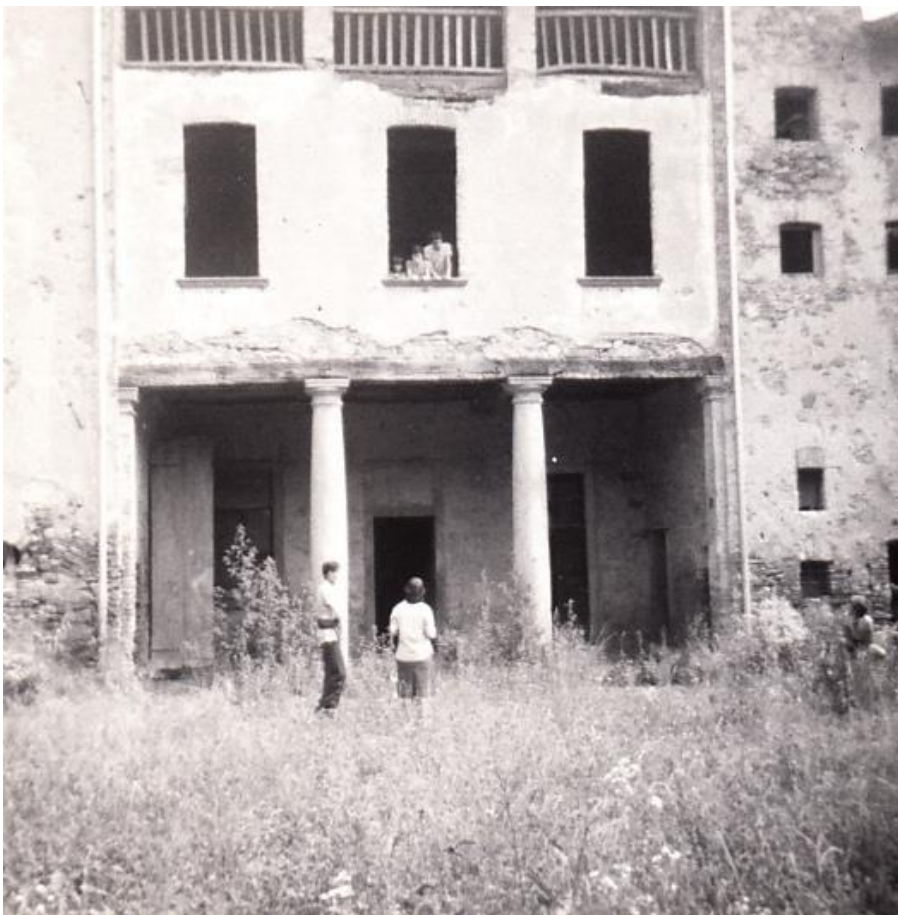
Zizzanorre nel 1978