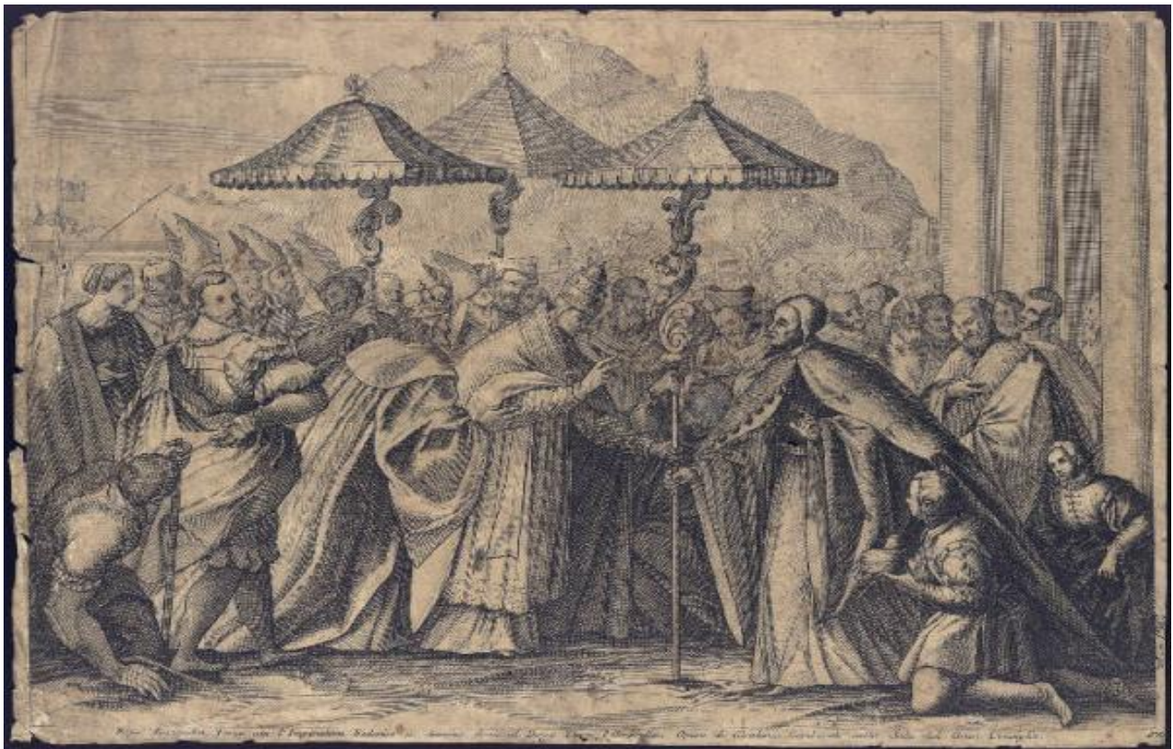
Papa Alessandro III con l'imperatore Federico Barbarossa e il Doge Sebastiano Ziani ad Ancona (stampa di Rossetti Domenico e Gambarato Girolamo)

Alessandro III , senese, al secolo Rolando Bandinelli (1100-1181), fu il 170° papa dal 1159 alla morte. A lui nel 1168 fu dedicata la città piemontese di Alessandria, edificata tra la Bormida ed il Tanaro in funzione anti-imperiale, per tenere a freno i marchesi di Monferrato e Pavia, alleati di Federico Barbarossa.