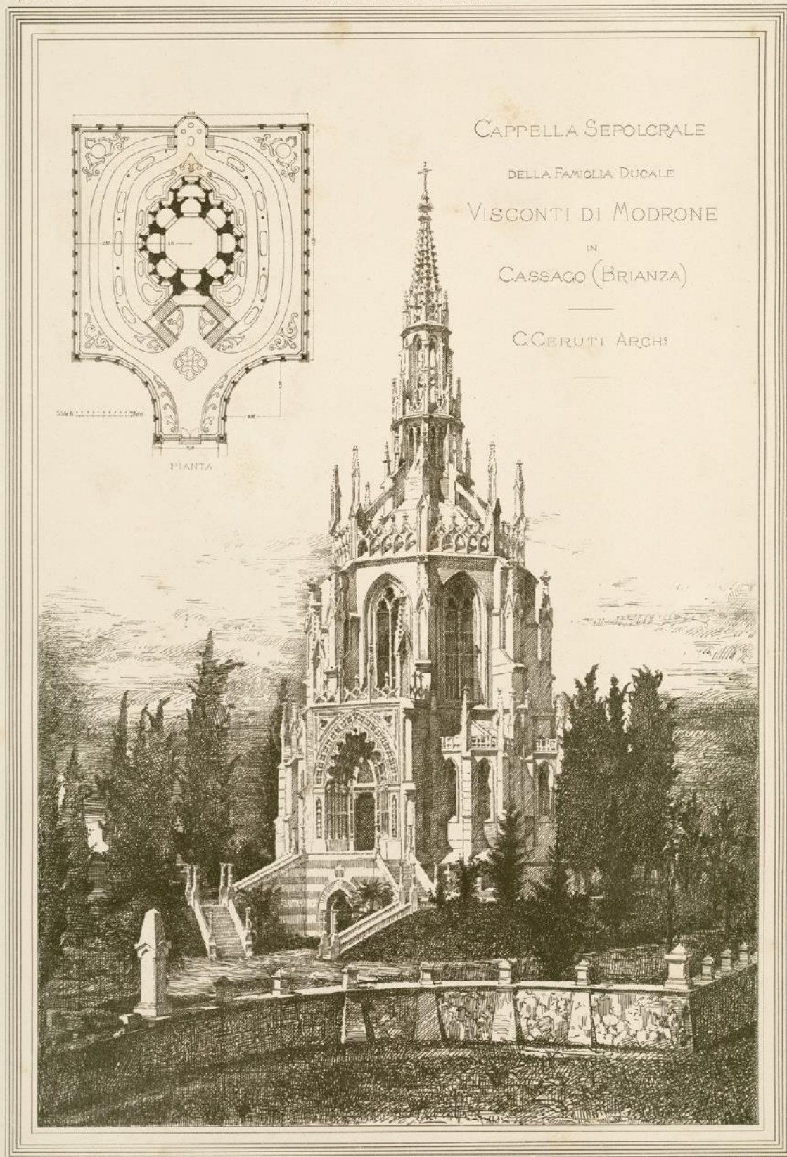
Veduta della Cappella Sepolcrale della famiglia ducale Visconti di Modrone in Cassago