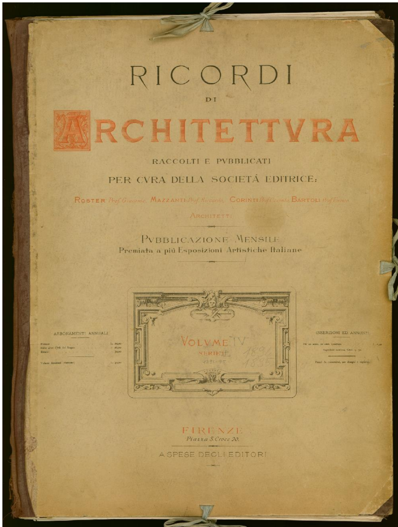
Copertina del testo a stampa Ricordi di architettura: raccolti autografati e pubblicati da una società di architetti fiorentini (1894-1895) , che riporta uno studio della Cappella Sepolcrale Visconti di Modrone edificata a Cassago.