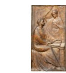
Associazione Storico Culturale Sant'Agostino