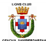
LIONS CLUB GENOVA SAMPIERDARENA