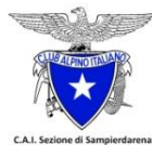
C.A.I. Sezione di Sampierdarena