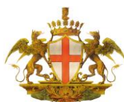
COMUNE DI GENOVA